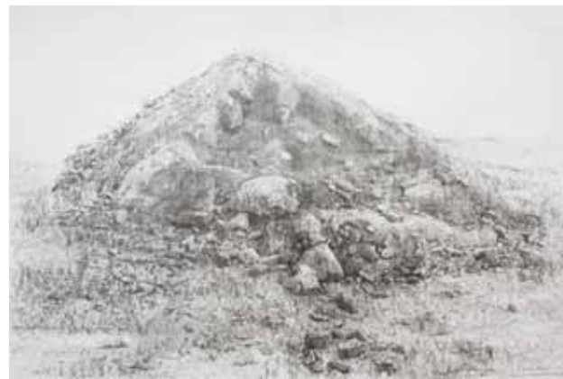
Série "Montañas de tierra n°5", 2011, crayon sur papier, 100x 70cm.