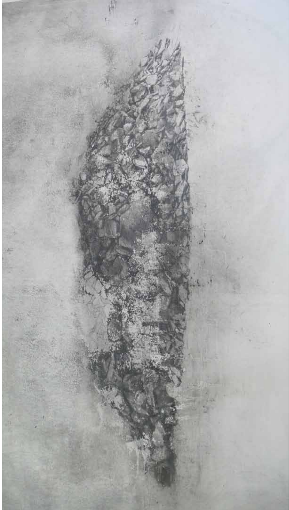
Série "Montañas de tierra n°7", 2011, crayon sur papier, 100x 70cm.