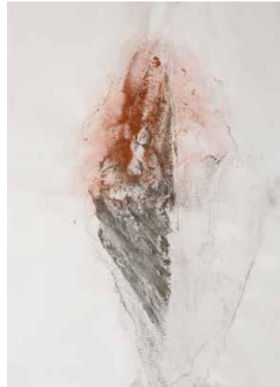
Série "Montañas de tierra n°8", 2011, crayon sur papier, 70x 50cm.