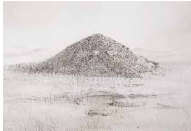
Série "Montañas de tierra n°6", 2010, crayon sur papier, 100x 70cm.

Galerie d'art ARCADE CHAUSSE-COQS Vernissage : jeudi 23 juin dès 18h, 16 rue du Chausse-Coq, 1204 Genève, tel. 022 310 06 30 Exposition : du 23 juin au 2 juillet 2011. www.andresmoyya.com. Tel. (+34) 679 94 30 29.