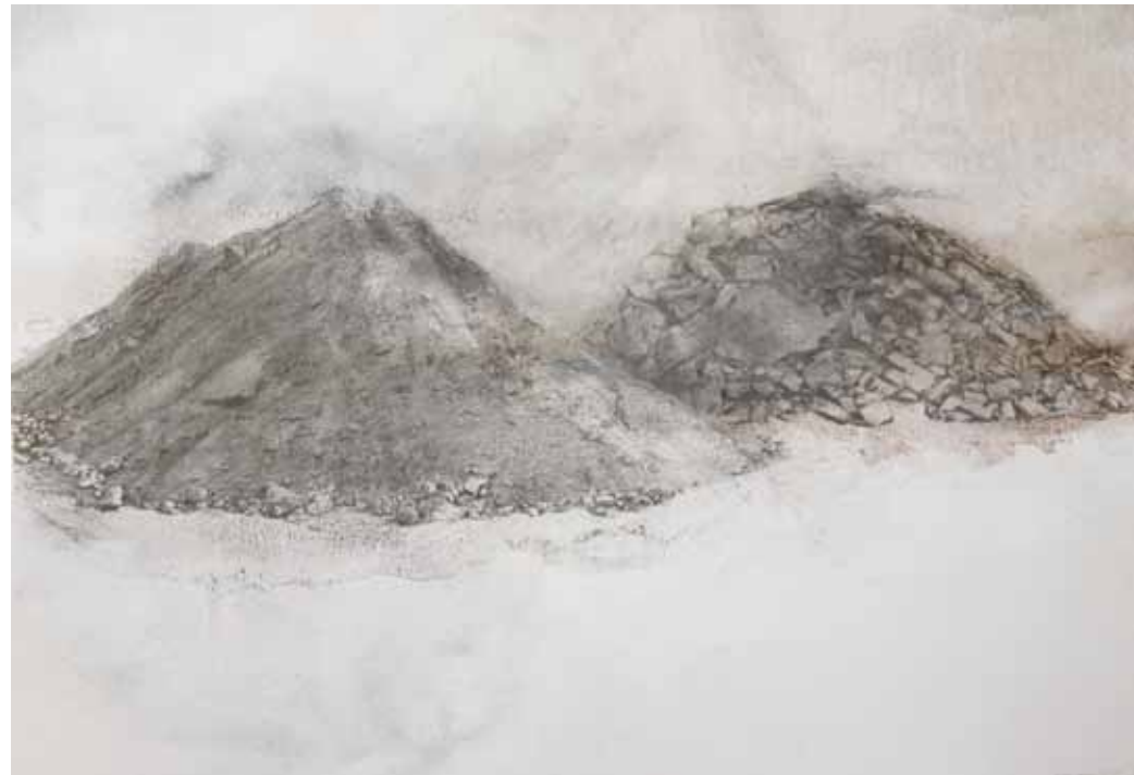
Série "Montañas de tierra n°11", 2010, crayon sur papier, 100x 70cm.

ARCADE CHAUSSE-COQS Galerie d'art du 23 juin au 2 juillet 2011.