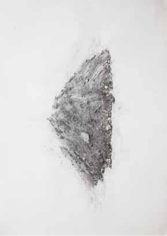
Série "Montañas de tierra n°2", 2010, crayon sur papier, 70x 50cm.