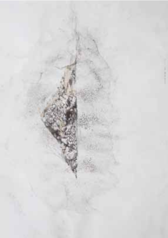
Série "Montañas de tierra n°9", 2011, crayon sur papier, 70x 50cm.